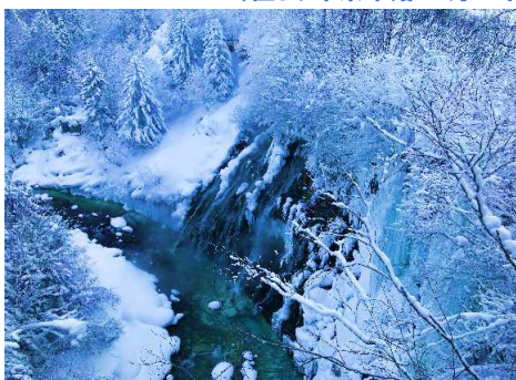
白ひげの滝(イメージ)