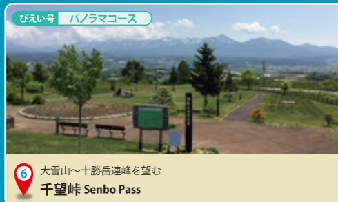
6 大雪山〜十勝岳連峰を望む 千望峠 Senbo Pass

広大な敷地に季節に合わせて様々な花が帯状に咲き誇り、近くはもちろん遠くの花畑までも訪れる方々を楽しませてくれます。15分で園内を1周できるトラクターバスやレストラン、アルパカ牧場があります。 コロケ (男爵・北あかり)