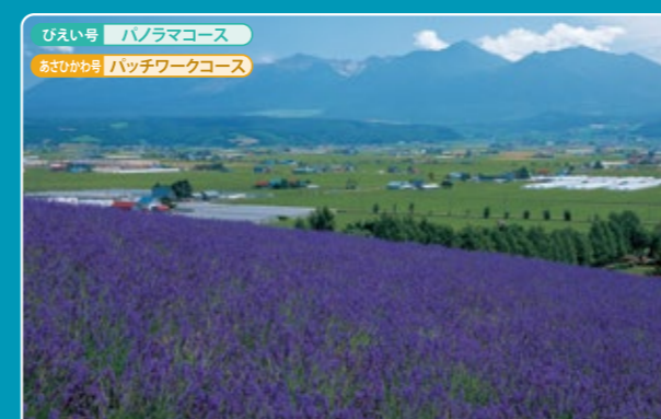
8 80種類もの花々が丘陵を彩る ファーム富田 Farm Tomita

園内にはたくさんの畑がありラベンダーはもちろん、ポピー、ルピナス、ケイトウ、マリーゴールドなど季節によって色とりどりの花が植えられています。ラベンダーの見頃は例年6月下旬から8月上旬にかけてですが畑にラベンダーが咲いていない時期でも温室でご覧いただくことができます。富良野地方は水はけが良く風の通る丘陵地帯と気候がラベンダーの栽培に適しており、ようてい、濃紫早咲、はなもいわ、おかむらさき等を栽培しています。ファーム富田の原点となった歴史あるトラディショナルラベンダー畑。見る、香りを感じるほかにラベンダーエキスをを使用したドリンクやソフトクリームが人気です。