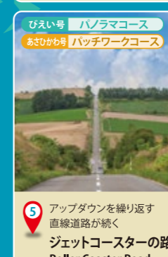
5 アップダウンを繰り返す直線道路が続く ジェットコースターの路 Roller Coaster Road