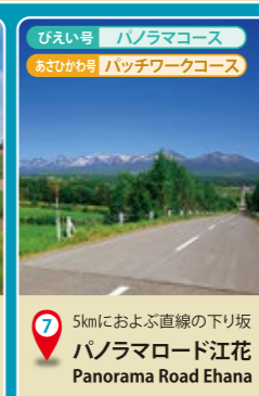
7 5kmにおよぶ直線の下り坂 パノラマロード江花 Panorama Road Ehana