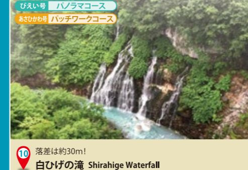
10 落差は約30m! 白ひげの滝 Shirahige Waterfall