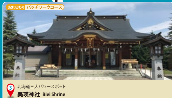
3 北海道三大パワースポット 美瑛神社 Biei Shrine

恋愛運アップのパワースポット美瑛神社。ハートマークが境内のあちこちにありますが実は魔除け模様の猪目の形。また、トウモロコシのえぞみくじなど、ユニークなおみくじがあります。