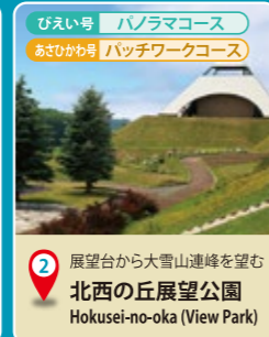
2 展望台から大雪山連峰を望む 北西の丘展望公園 Hokusei-no-oka (View Park)