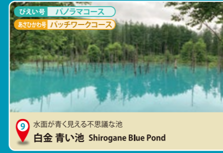
9 水面が青く見える不思議な池 白金 青い池 Shirogane Blue Pond