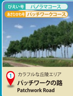
1 カラフルな丘陵エリア パッチワークの路 Patchwork Road