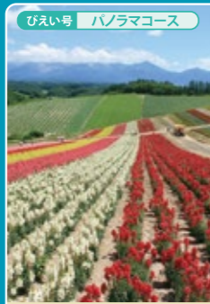
4 数十種類の花が咲く展望花園 四季彩の丘 Shikisai-no-oka【Flower Park】

広大な敷地に季節に合わせて様々な花が帯状に咲き誇り、近くはもちろん遠くの花畑までも訪れる方々を楽しませてくれます。15分で園内を1周できるトラクターバスやレストラン、アルパカ牧場があります。 コロケ (男爵・北あかり)